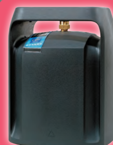
Le Cube, 25 ans et toujours dans le ton.