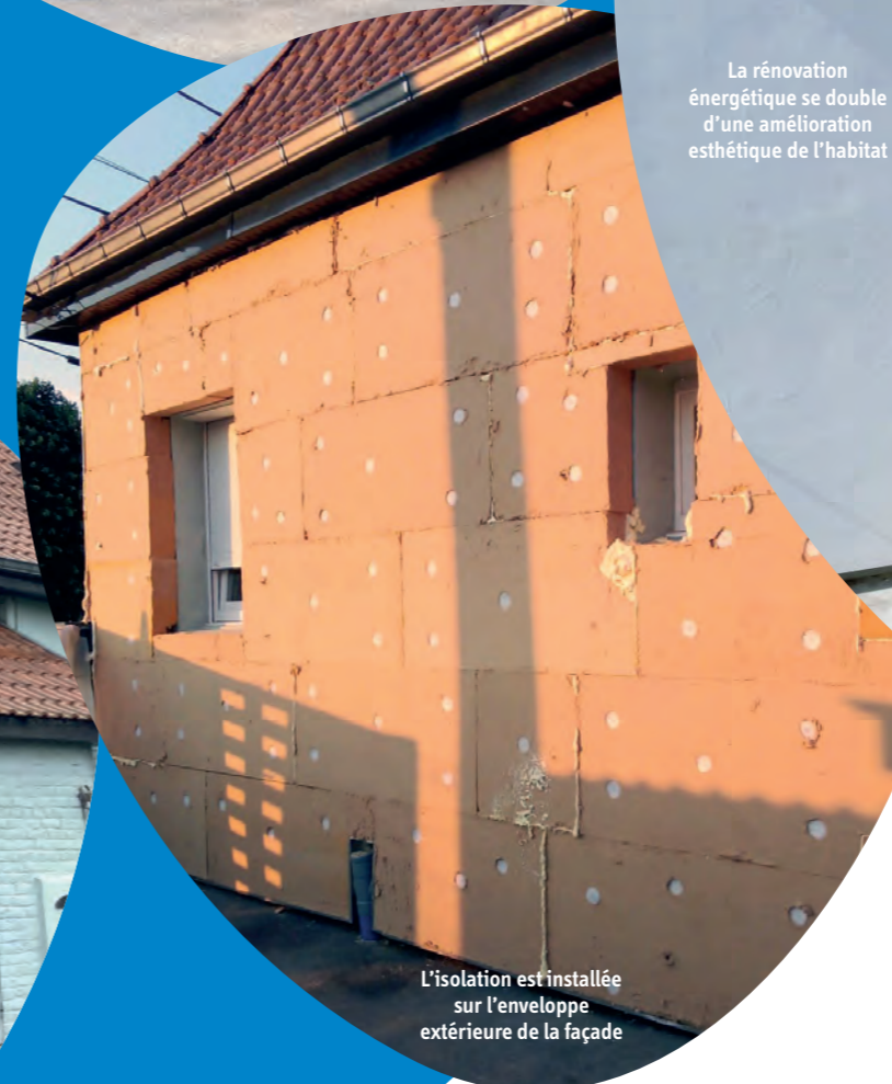
L'isolation est installée sur l'enveloppe extérieure de la façade