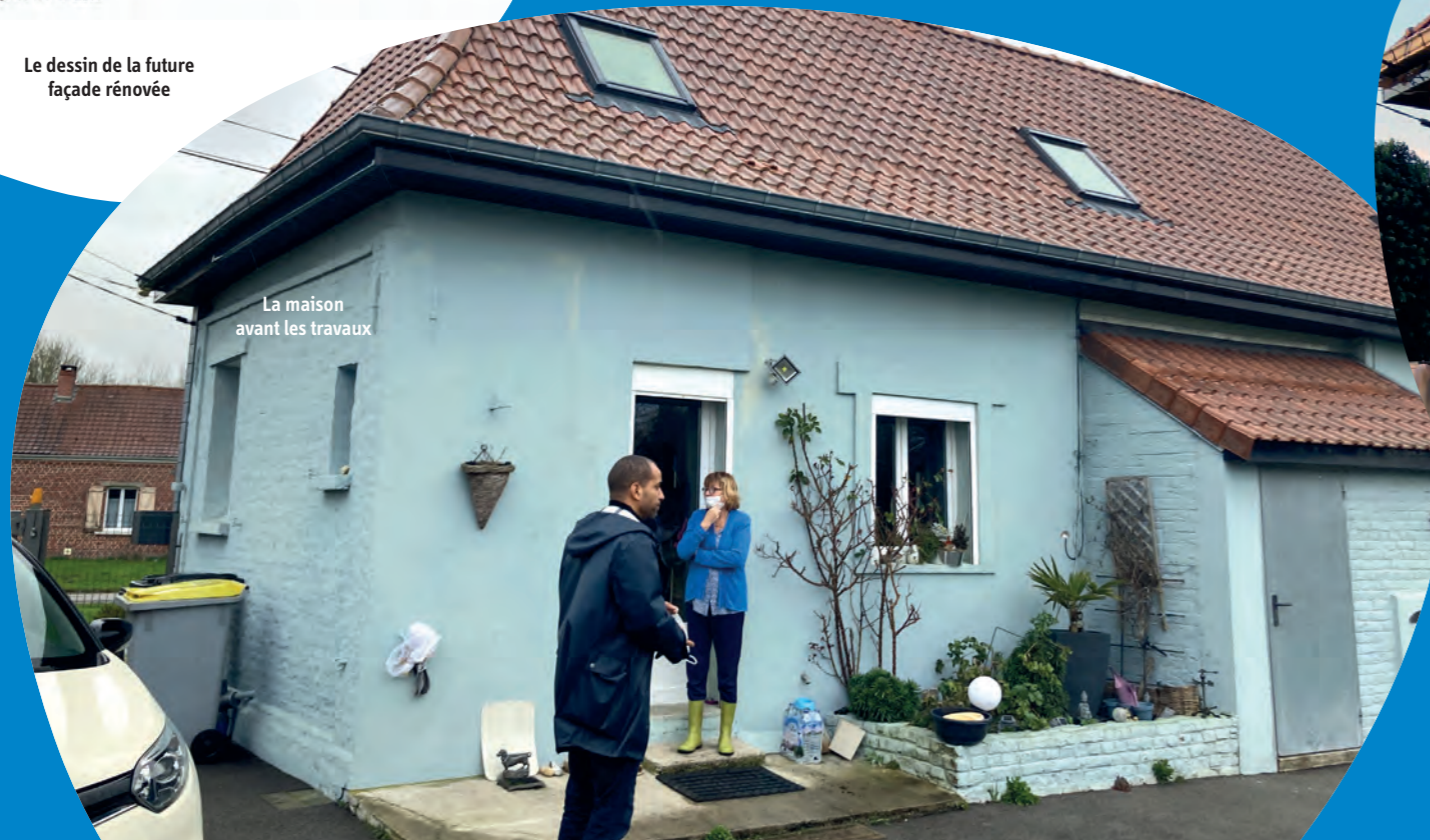
La maison avant les travaux