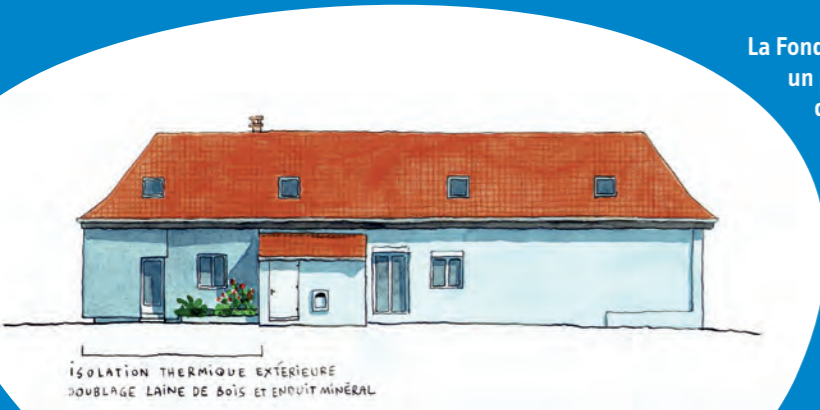
ISOLATION THERMIQUE EXTERIEURE DOUBLAGE LAINE DE BOIS ET ENDUIT MINERAL

Les intervenants de la mairie de Flers, l'équipe de la Fondation Butagaz et les architectes réunis devant la mairie école faisant l'objet d'un programme de rénovation.