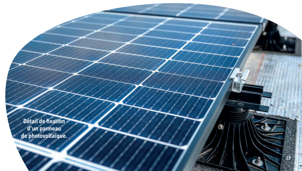
Détail de fixation d'un panneau de photovoltaïque.

Un stage de 2 semaines chez Solewa vient clôturer le parcours et sert à valider l'intérêt pour le métier. Une démarche similaire est amorcée pour les formations supérieures : des rencontres avec les établissements qui proposent ce type de cursus sont programmées. « Dans l'immédiat, nous allons nous attacher à finaliser les contenus pédagogiques avec le CFA Bâtiment et les AFPA Vendée et Finistère qui vont mobiliser nos collaborateurs ayant le désir de transmettre leur savoir-faire. Il nous faut aussi donner plus de visibilité à nos métiers qui restent souvent méconnus. Certes, ils sont soumis aux contraintes inhérentes au secteur du bâtiment, comme les intempéries ou les grands déplacements, mais ils laissent surtout une grande part à l'autonomie pour une activité qui a du sens dans le contexte de la transition énergétique. Pour des personnes sans formation ou éloignées de l'emploi, c'est un tremplin pour leur reconversion, avec des possibilités d'acquérir rapidement des responsabilités ! », conclut Quentin Pourreau.