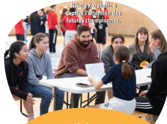
Nikola Karabatic a captivé l'attention des futures championnes.

4 à 5 ans, nous espérons voir évoluer quelques-unes de nos jeunes joueuses dans la Ligue Butagaz Énergie ! Nous avons découvert le challenge "au plus près des clubs" via un post de la société Butagaz sur les réseaux sociaux. Nous nous sommes immédiatement mobilisés et notre alternante en communication - Berfine Ozekinci - nous a tous sensibilisés avec une forte conviction. En effet, nous avons même des parents de joueurs qui ont convaincu des collègues de travail de poster pour nous ! Et nous avons réussi au-delà de nos espérances... outre les deux jeux de maillots qui équipent nos sections des moins de 10 ans et des moins de 15 ans, nous avons eu la chance de pouvoir participer à une rencontre avec Nikola Karabatic ! Je peux vous dire que tous les gamins qui ont participé à l'opération avaient des étoiles dans les yeux ! »