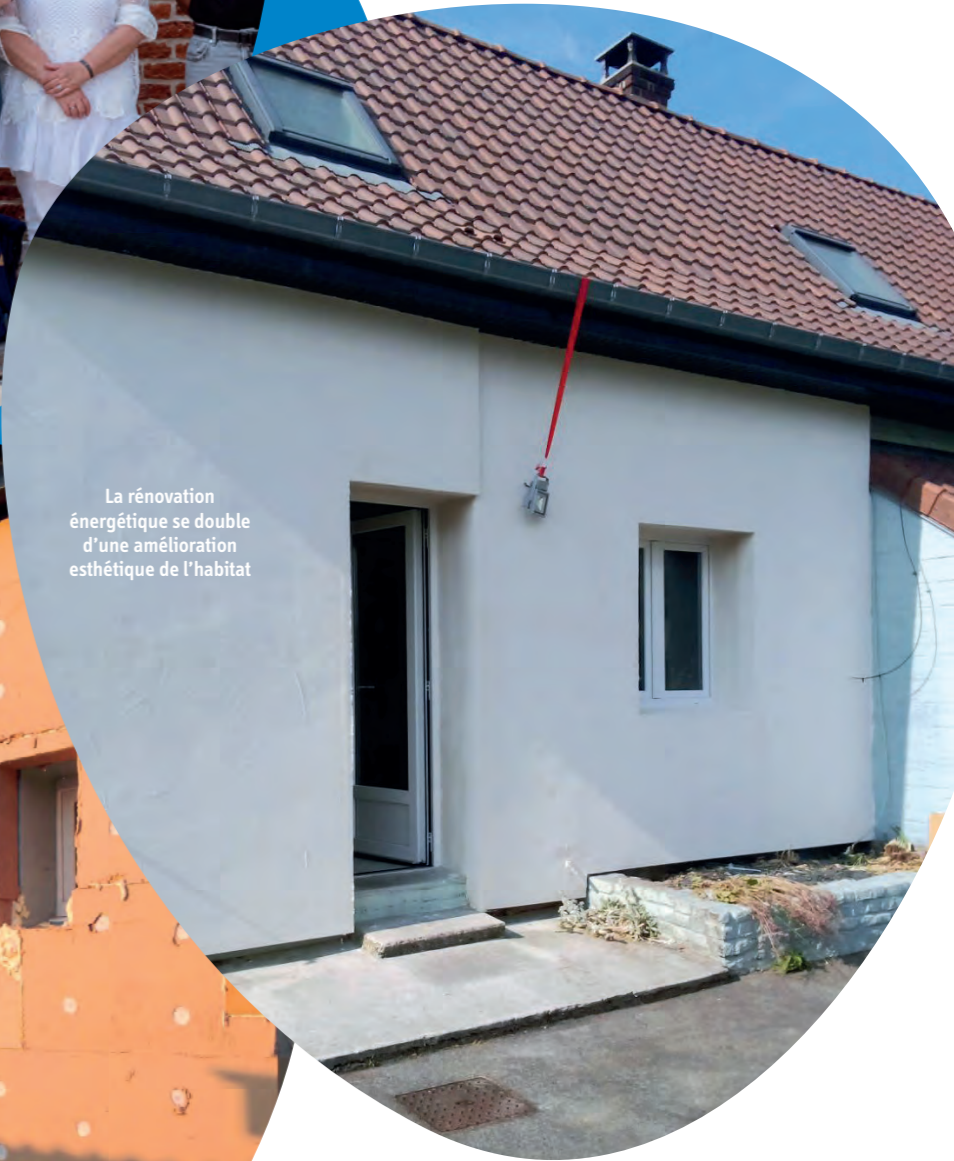
La rénovation énergétique se double d'une amélioration esthétique de l'habitat