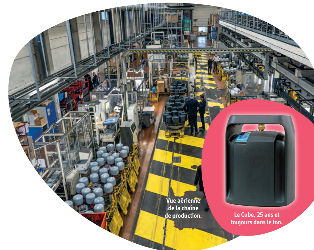
Vue aérienne de la chaîne de production.